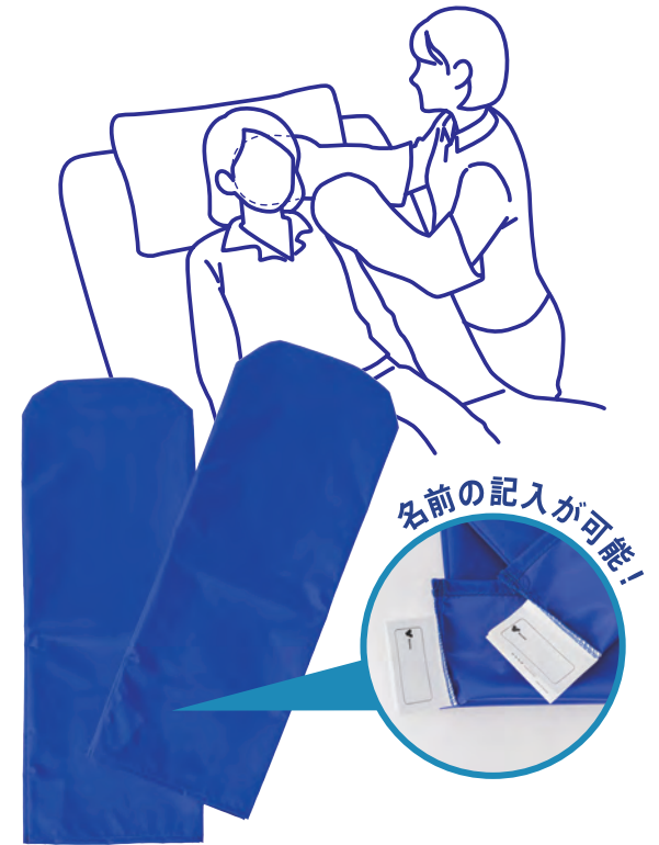
名前の記入が可能!